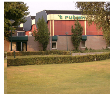
Sporthal 't Ruiven

Het vervoer naar een uitwedstrijd wordt door de aanvoerder(ster) of de begeleider(ster) /coach geregeld. Bij de jeugdteams wordt hierbij een beroep gedaan op de ouders.