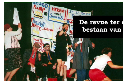
De revue ter ere van het 25-jarig bestaan van HV White Demons

Een aantal keer per jaar organiseert de jeugd- en activiteitencommissie voor de jeugd en senioren een feestavond. Gedurende het zaalseizoen worden er activiteiten georganiseerd, zoals een barbecue en de haast traditionele playback show.